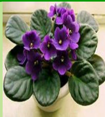
Фиалки с разной окраской цветков.